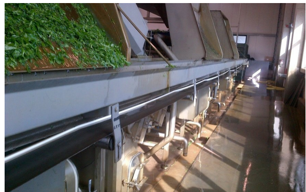
↑ Cinta Transportadora