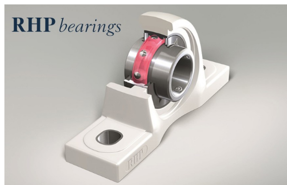
↑ NSK Life-Lube con inserto Molded-Oil