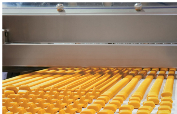
↑ Línea de Corte