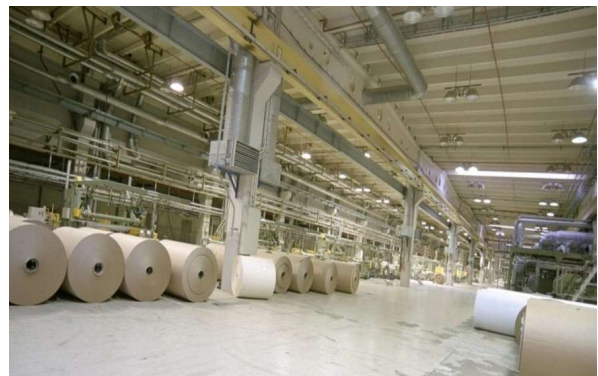
↑ Rodillos de Papel