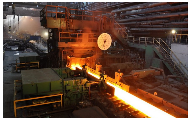
↑ Sección final del Laminador de Banda en Caliente